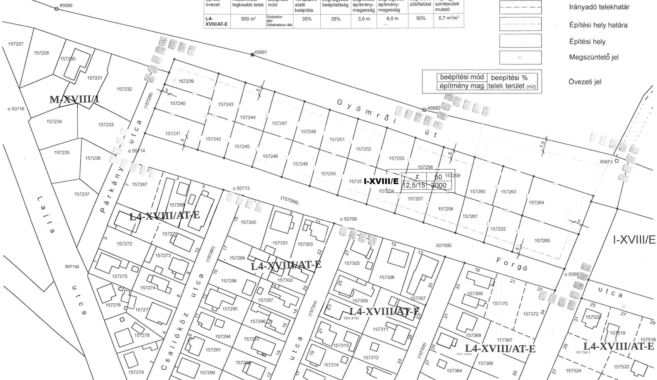
1. sz. melléklet: SZABÁLYOZÁSI TERV M=1:1000